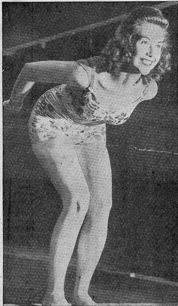
¿Qué empujoncito le daríamos a esta preciosidad...!